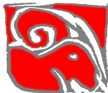
Image non disponible, l'article n'ayant pas fait l'objet d'une publication.