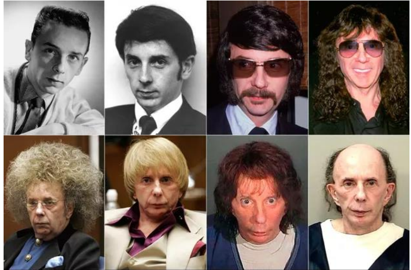
Phil Spector en 1957, 1965, 1980, 2000, 2005, 2007, 2009 et 2013.

Il faut dire que le personnage est pour le moins instable, atteint de troubles psychologiques chroniques, qu'il appelait ses « démons »... Déjà à l'époque de son succès, il venait toujours armé en studio et, peu à peu, sa personnalité à deux visages se révèle de façon de plus en plus évidente : d'une part une personne qui manquait cruellement de confiance en elle-même, cherchant désespérément à se faire aimer et, d'autre part, un tyran paranoïaque, imbu de son génie, usant de menaces et d'armes à feu pour parvenir à ses fins.